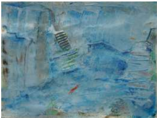
Blau1 | 2018

2016 nahm ich die Blätter wieder hervor und strich Wasser über einige Blattbereiche. Damit lösten sich bis auf wenige Stellen die Tintenformen auf und die Farbe verteilte und mischte sich über das Blatt. Im nächsten Arbeitsschritt begann ich in collagierender Arbeitsweise vereinzelt Papierreste und Fragmente von Wellpappe auf einzelne Blätter zu kleben. In einem einzigen Arbeitsgang verteilte ich durchgehend auf allen Blättern mit einem breiten Pinsel wässriges Blau. Der nächste Arbeitsschritt erfolgte dann auf jedem einzelnen Blatt. Dabei setzte ich mit Ölkreiden, Farbstiften und Kreidestiften Linien, Verdichtungen oder Weisslichter. Jedes der Werke steht für sich und bildet gleichzeitig zusammen ein Ganzes, einen Fluss, eine Bewegung.