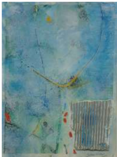
Blau2 | 2018 Mixed Media auf Aquarellpapier 36 x 48 cm 20180430_2