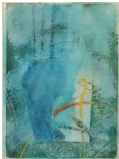
Blau8 | 2018 Mixed Media auf Aquarellpapier 36 x 48 cm 20180430_8