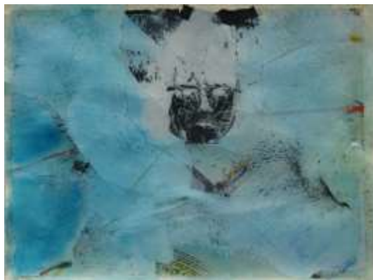
Blau6 | 2018 Mixed Media auf Aquarellpapier 36 x 48 cm 20180430_6