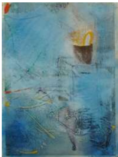
Blau3 | 2018 Mixed Media auf Aquarellpapier 36 x 48 cm 20180430_3