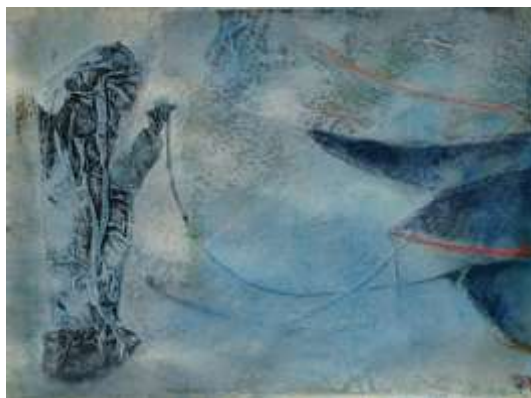
Blau7 | 2018 Mixed Media auf Aquarellpapier 36 x 48 cm 20180430_7