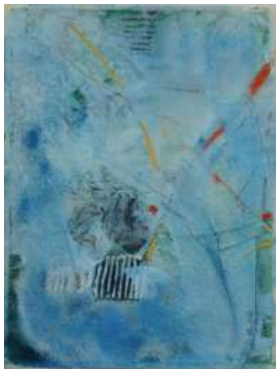
Blau4 | 2018 Mixed Media auf Aquarellpapier 36 x 48 cm 20180430_4