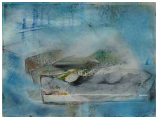
Blau5 | 2018 Mixed Media auf Aquarellpapier 36 x 48 cm 20180430_5