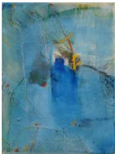
Blau9 | 2018 Mixed Media auf Aquarellpapier 36 x 48 cm 20180430_9