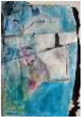
15 | 20161121 | 2016 | FragmentMalerei | 88x57cm