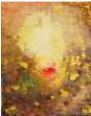
16 Mikha`el | 2011 | Gouache auf Papier mit Resonance Gold | 48x36cm