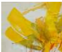
21 Inner color of the day | 2016 | CollagenMalerei auf Papier | 24x30cm