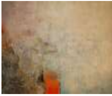
14 Nirwana | 2016 | CollagenMalerei auf Leinwand mit ResonanzGold | 100x80cm