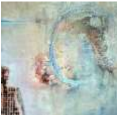
26 Der Beobachter | 2016 | CollagenMalerei | 40x40cm