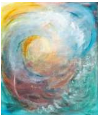
27 Meditation | 2003 | Gouache auf saugender Papppe | 100x90cm