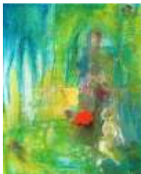
22 Mittendrin die Schweiz | 2011 |

Mischtechnik auf Pappe mit ResonanzGold | 50x40cm