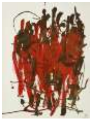
10 Bürger von Calais | 2010 | Tinte auf Papier | 55x42cm