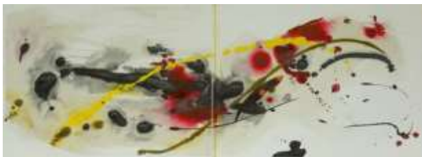
23 Vulcano di notte | 2010 |

Mischtechnik auf Pappe mit ResonanzGold | 50x40cm