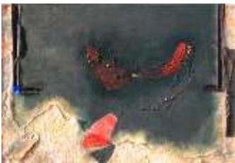
18 LebensFeldB | 2016 CollagenMalerei auf Leinwand mit ResonanzGold | 80x120cm