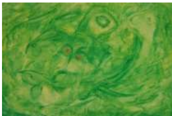
11 Die Frage | 2011 | Gouache und Farbstifte auf Leinwand | 50x70cm