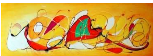
13 Farbe im Herz | 2011 | Mischtechnik auf Leinwand | 40x120cm