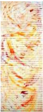
25 Morgenstimmung | 2010 | Gouache auf Reispapier | 200x60cm