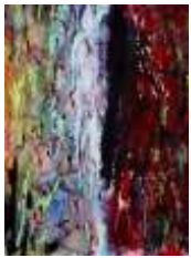
9 Die andere Hälfte | 2010 | Tinte und Kreide auf Papier | 56x42cm