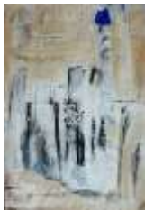
20 New Town in desert | 2015 |

19 Zentrum | 2008 | Mischtechnik | 3x120x40cm