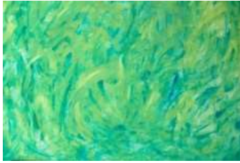
8 Das Geheimnis | 2011 | Gouache, Farbstifte auf Leinwand | 50x70cm