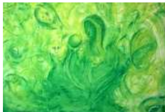
12 Die Offenbarung | 2011 | Gouache und Farbstifte auf Leinwand | 50x70cm